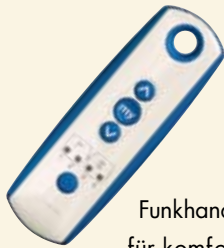
Funkhandsender für komfortable Steuerung Ihrer Markise