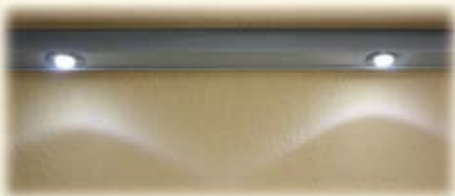
Lichtschiene, dimmbar für angenehme Atmosphäre auf Ihrer Terrasse oder Balkon