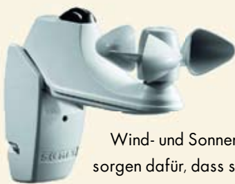
Wind- und Sonnensensor sorgen dafür, dass sich Ihre Markise selbständig und in kurzer Zeit jedem Wetter anpasst