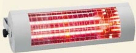
Sonnenwärme auf Knopfdruck – Terrassen- heizung mit moderner Infrarot-Technologie